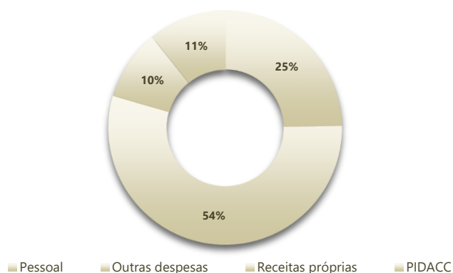
GRÁFICO 1: DISTRIBUIÇÃO DA DESPESA

Deste total, 24% é representativo das despesas com pessoal, 54% outras despesas, 10% despesas próprias e 11% do Programa de Investimentos e Despesas de Desenvolvimento da Administração Central (PIDACC).